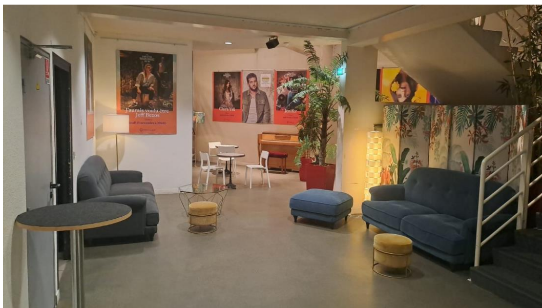
Théâtre Roger Barat / Sous-sol niveau -1

La consultation porte sur la restauration avant et après spectacle à destination du public et avant ou après spectacle pour la restauration des équipes artistiques quand cela est nécessaire . Elle permettra de procéder à la sélection préalable des candidats souhaitant proposer un service de restauration à destination du public spectateur fréquentant le théâtre Roger Barat. La sélection définitive du prestataire retenu aura lieu après une phase de pré-sélection et d'analyse des offres de produits et/ou de prestations des candidats.